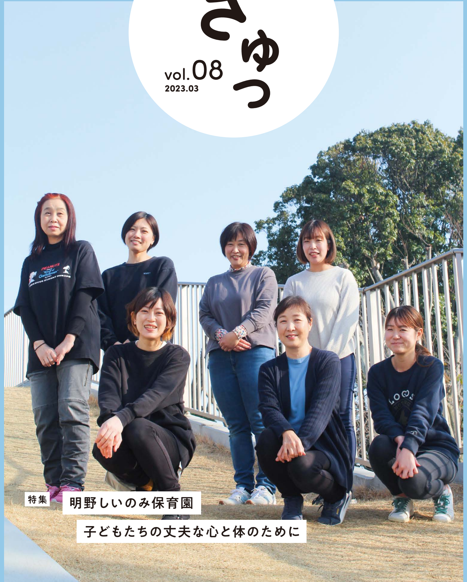
特集 明野しいのみ保育園