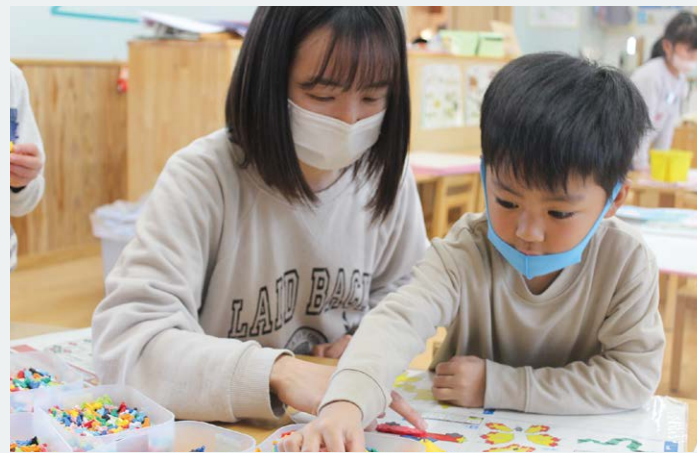
遊びを通して主体性を育みます。