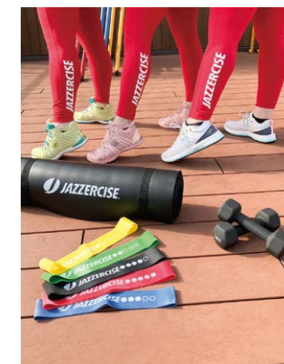
気分が上がるカラーでダンス

音楽に合わせて踊ることが大好きで、友だちに教えてもらったのをきっかけに始めました。初めは、インストラクターの動きに合わせて踊ることや筋トレについていっただけで必死でしたが、続けていくうちに自分の体が日々変化することに気がつきました。挑戦しても長続きしないダイエットもこれなら続けられ