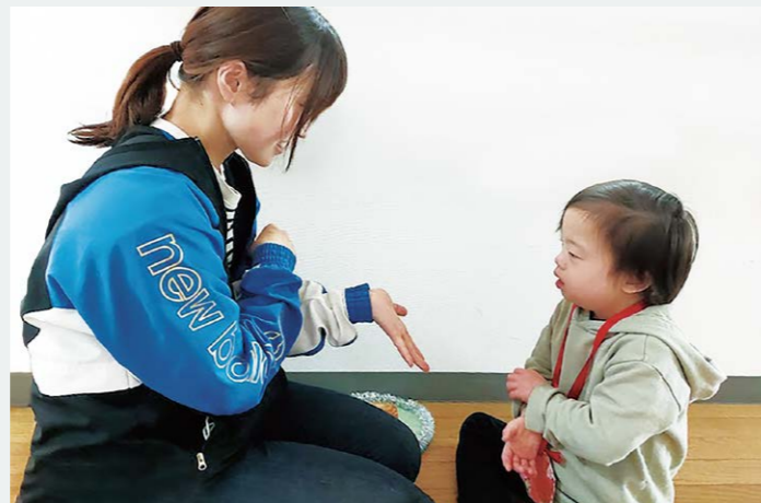
手話で会話の様子。表情や口の動きも見ながら子どもたちと一緒に練習しています

その都度、どうしたらいいか考える体験をしてほしい」と話していました。取材前は、「清明あけぼの学園」と関わる機会がほとんどなく、厳しくて、大変そうというイメージでした。実際に訪ねると職員が明るく、子どもたちとの温かい関係性を感じました。