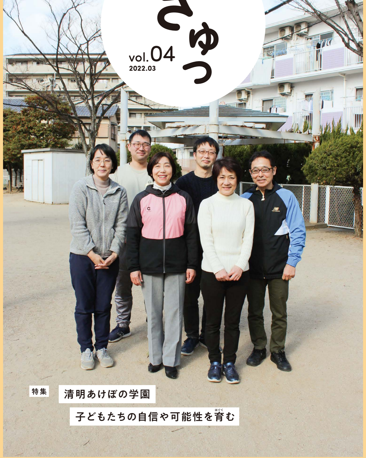
特集 清明あけぼの学園 子どもたちの自信や可能性を育む