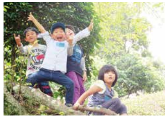
子育てサロンのんるん♪の様子

子育てや学校、家庭環境、生活のことなどでお困りの方に、専門的な知識をもつ相談員がお話を聞き、必要な支援機関へつなげます。子育てに不安を持つ保護者や家族のケア、学習プログラムも提供しています。